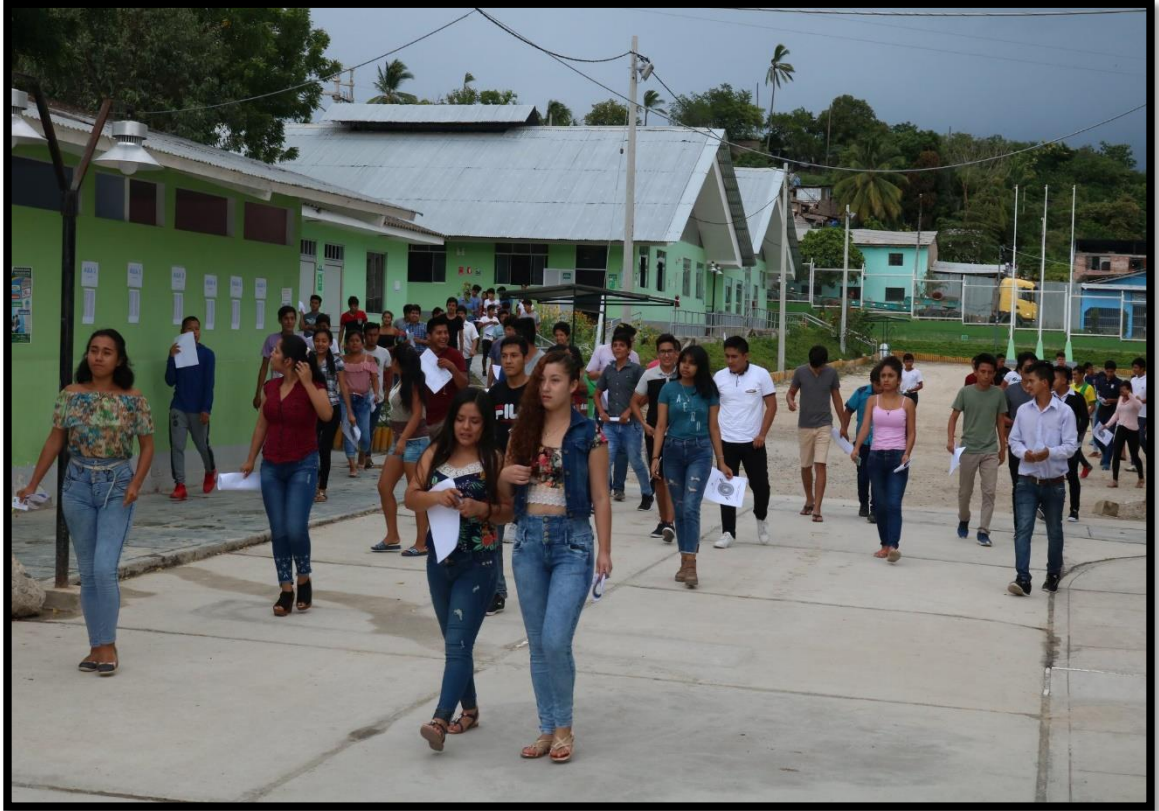
Estudiantes del Centro Preuniversitario, saliendo del Segundo Examen Parcial