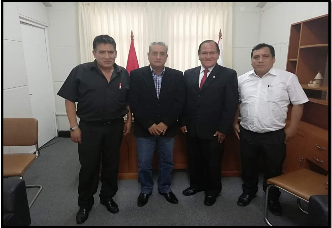
Gorea ofrece contundente apoyo a la Universidad Nacional Intercultural "Fabiola Salazar Leguía" de Bagua