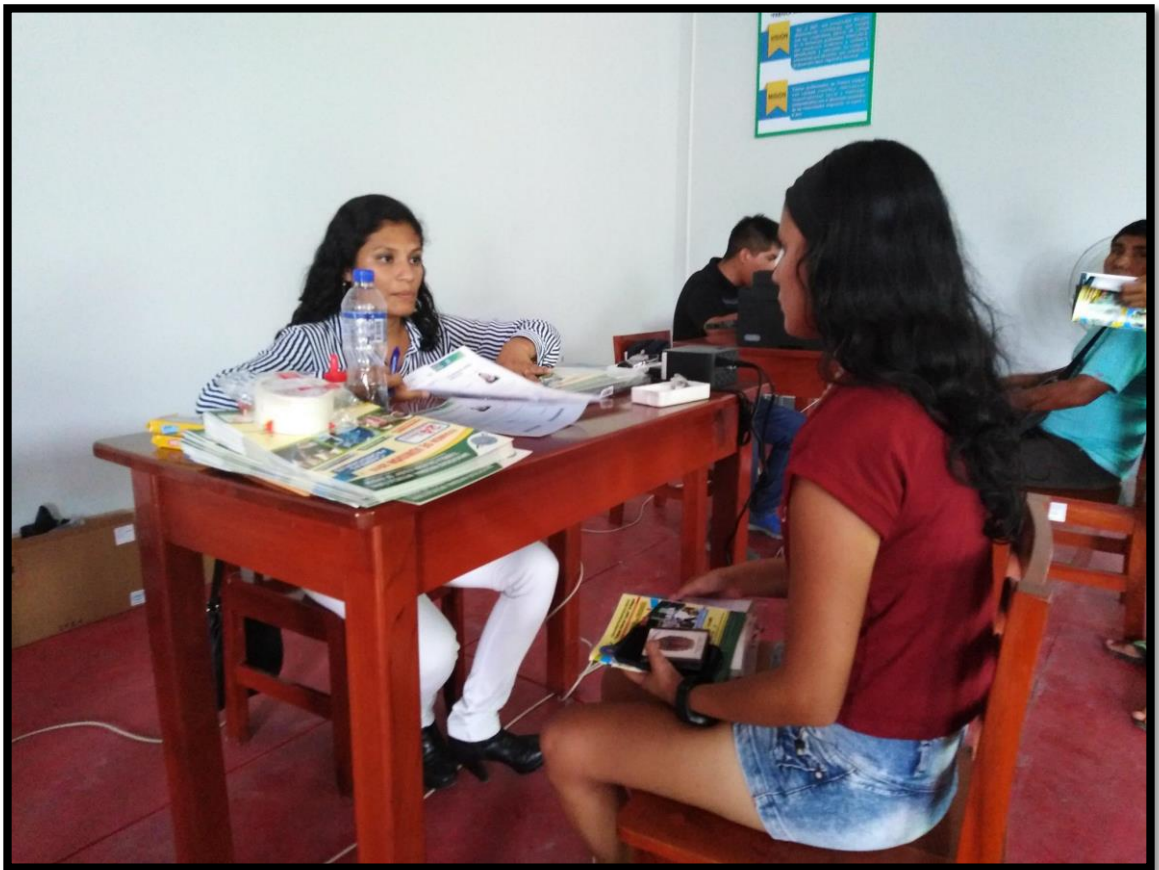
Inscripciones para el Examen de Admisión 2019 – I