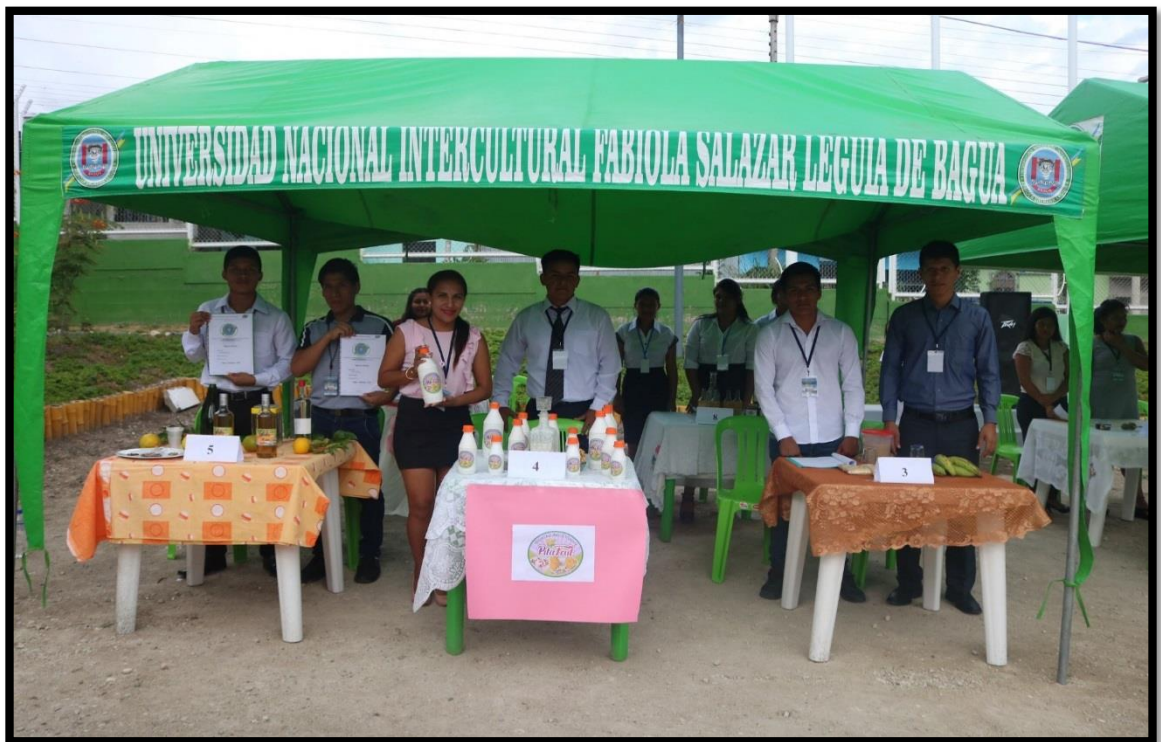
Estudiantes del Primer Ciclo de la Escuela Profesional de Negocios Globales, desarrollan con éxito la Feria “uniendo culturas generando empresas”