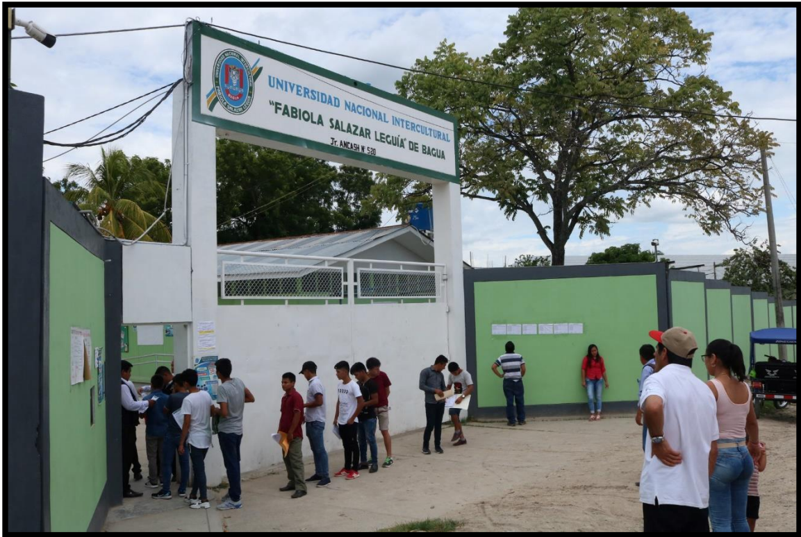
Aplicación del Examen Extraordinario 2019 – I