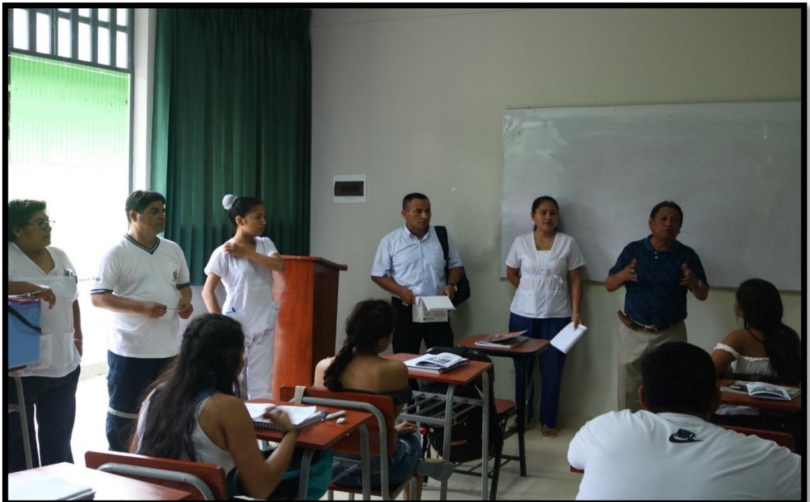
Campaña de vacunación a estudiantes y al personal administrativo