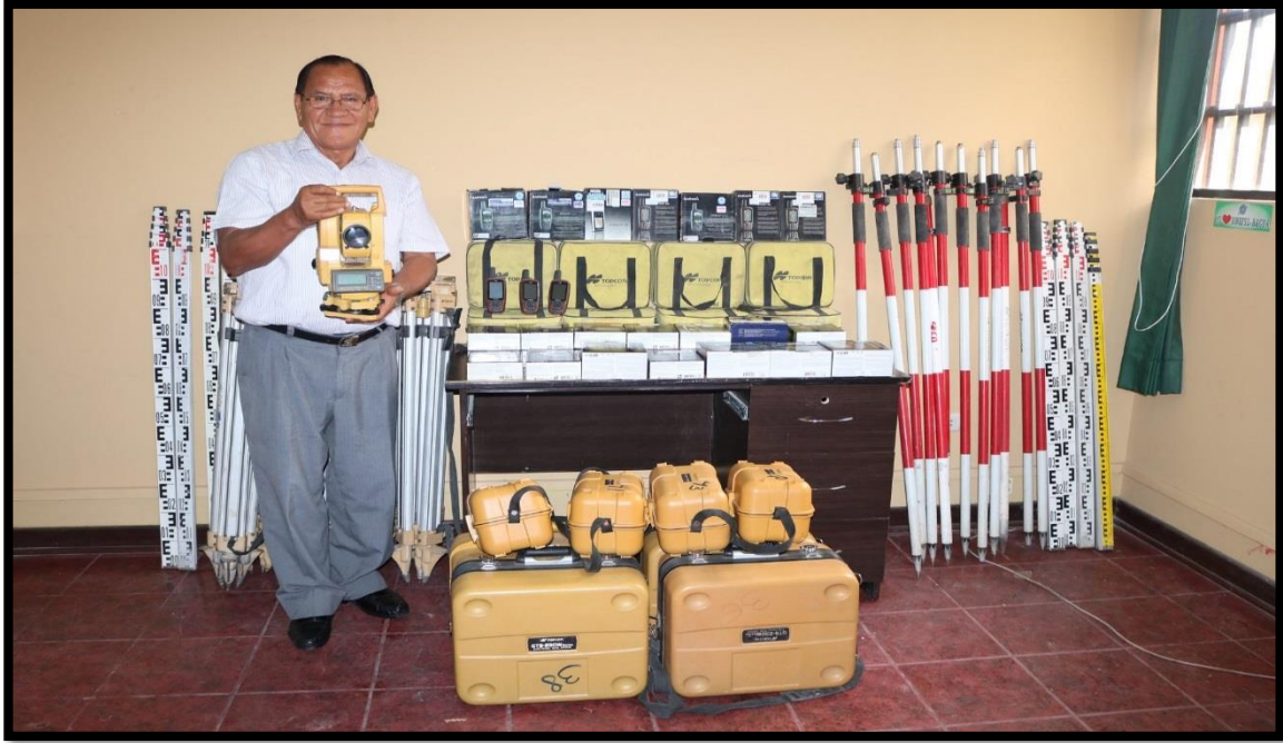
Programa Subsectorial de Irrigación (PSI) hace importante donación a la Universidad Nacional Intercultural “Fabiola Salazar Leguía” de Bagua