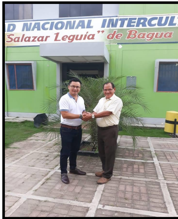
Cámara de Comercio de los Pueblos Indígenas del Perú, respaldan las gestiones de los miembros de la Comisión Organizadora