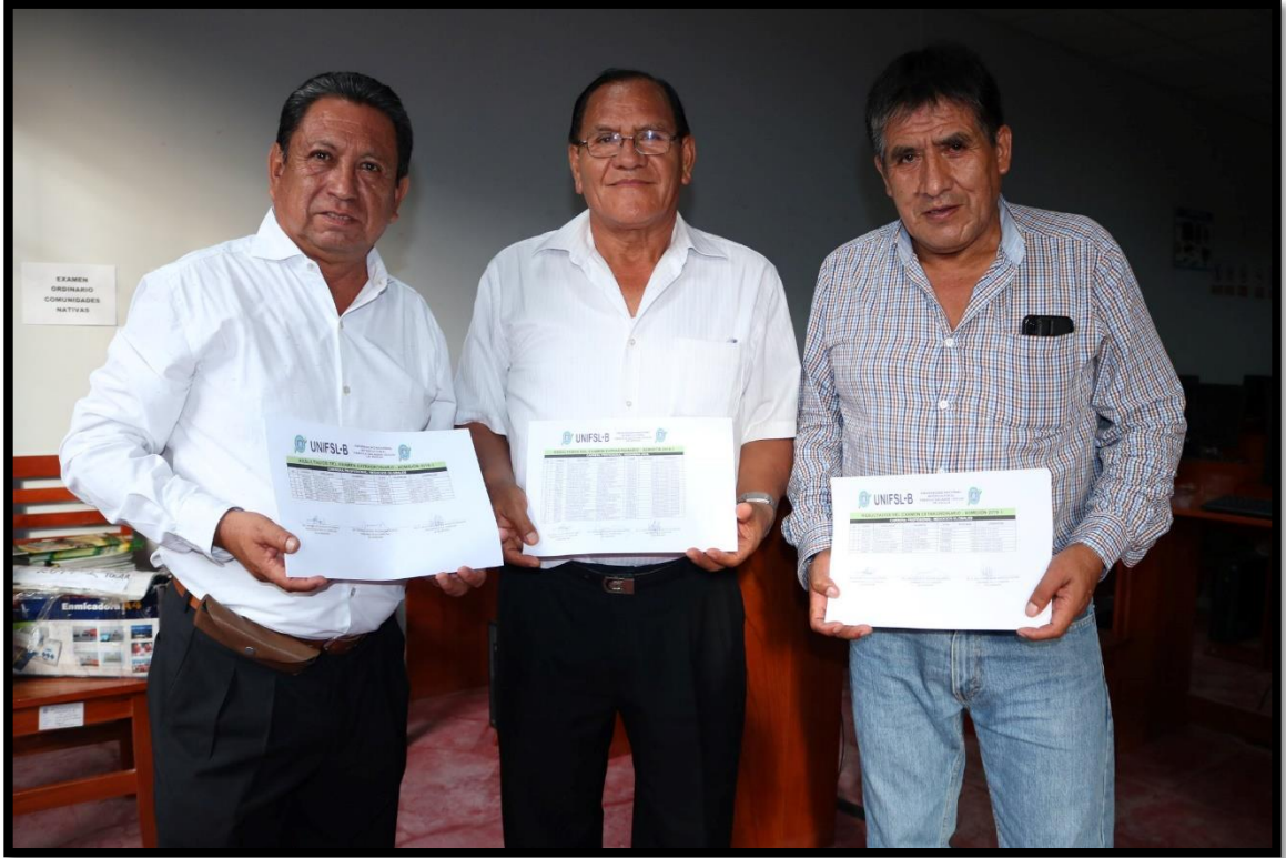
Miembros de la Comisión Organizadora publican resultados del Examen Extraordinario 2019 – I