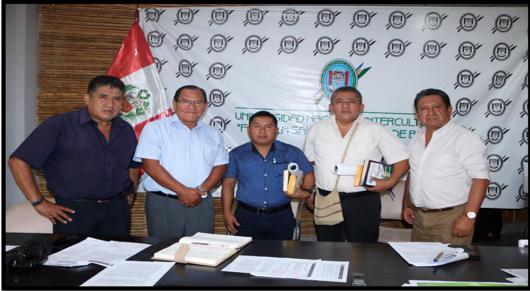
Miembros de la Comisión Organizadora en reunión con autoridades electas de la Municipalidad Provincial de Condorcanqui