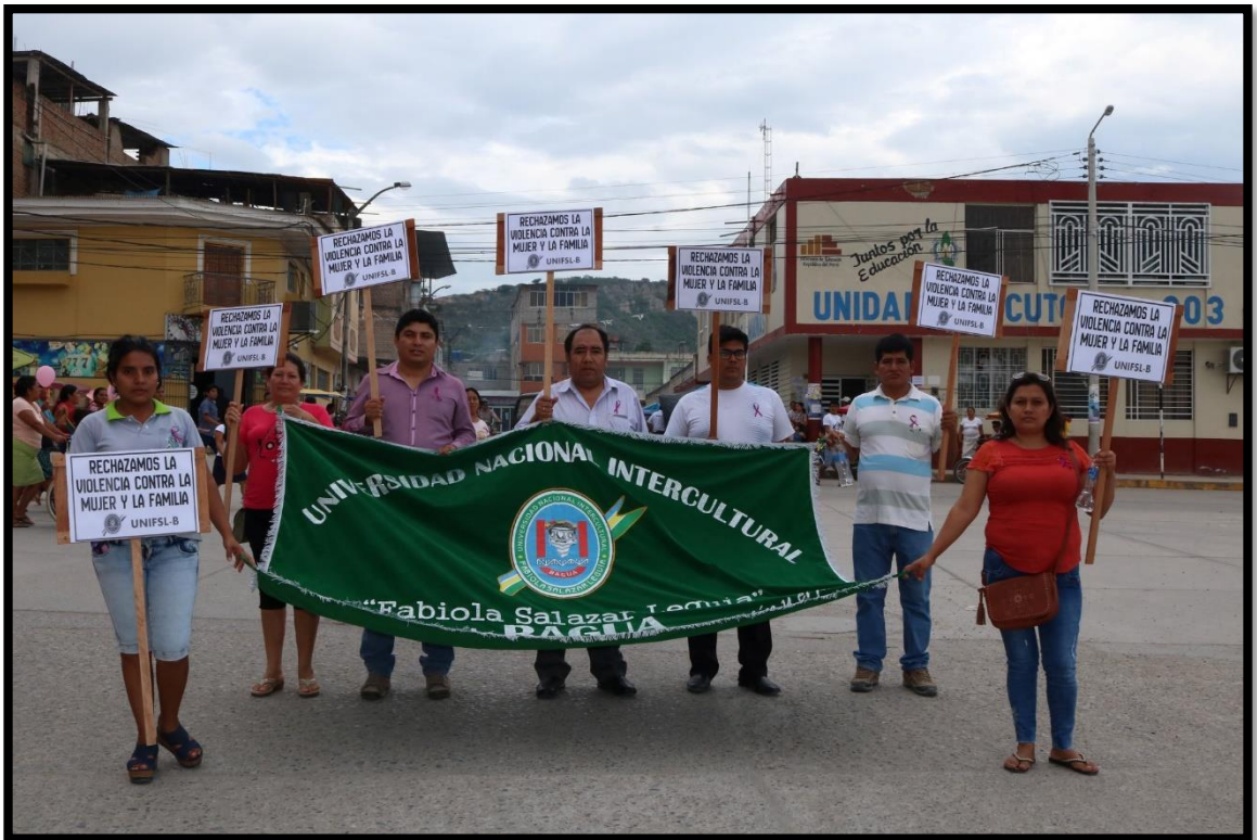
“Mujer protagonista del desarrollo”