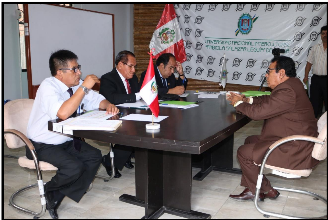
Entrevistas personales a los postulantes al proceso CAS N° 001 al 017