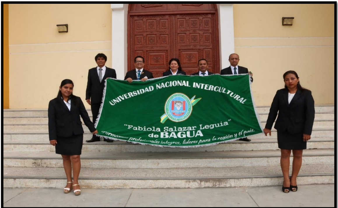
Después del desfile por el día internacional de la mujer