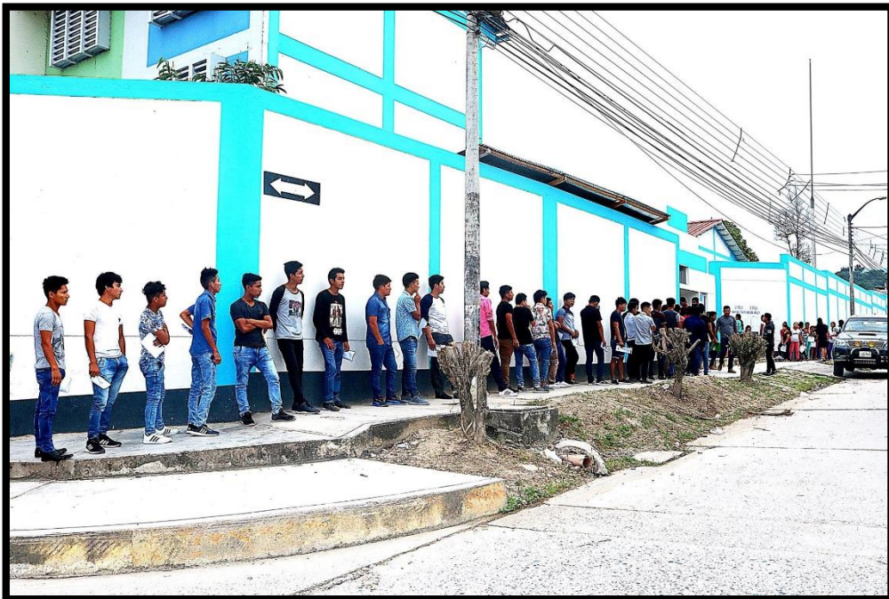
Postulantes ingresando a desarrollar la prueba del Examen de Admisión Ordinario 2019-I