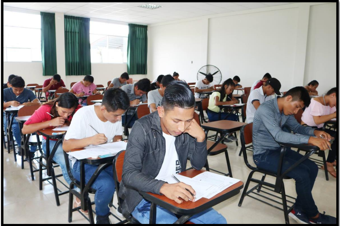
Desarrollando la prueba del Examen de Admisión Ordinario 2019-I