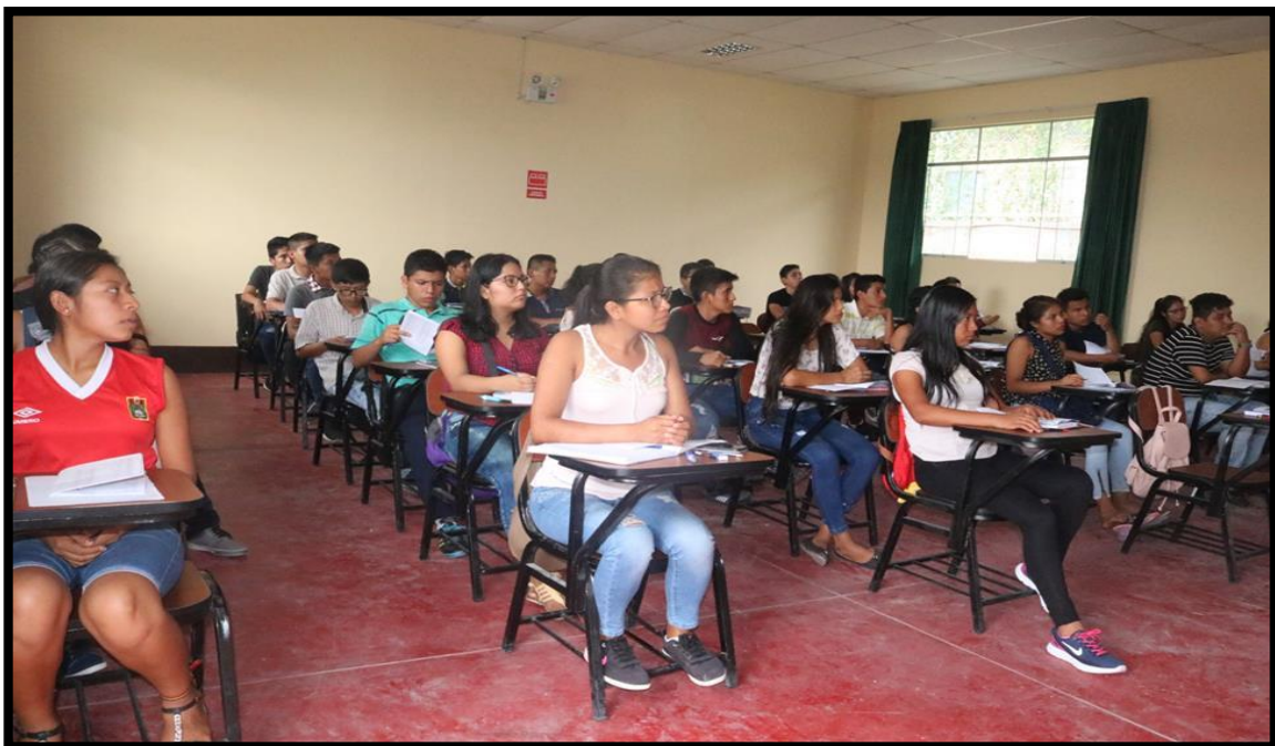
Estudiantes del Centro Preuniversitario recibiendo clases