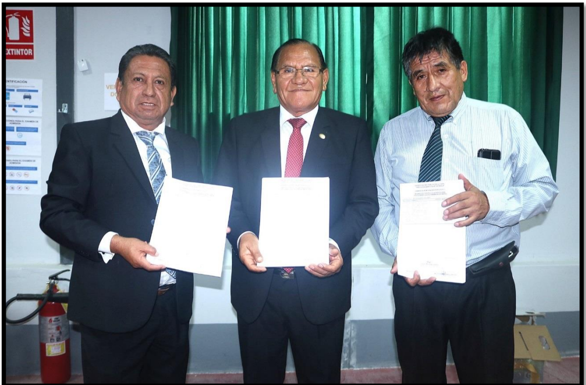
Miembros de la Comisión Organizadora de la Universidad publicando los resultados del Examen de Admisión Ordinario 2019-I