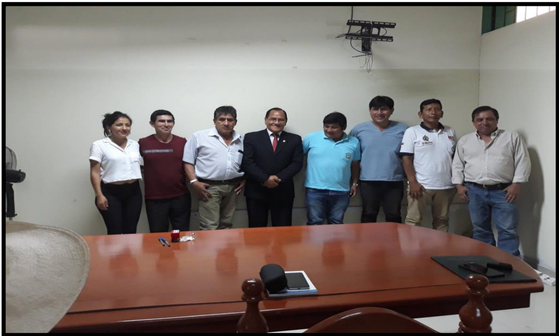
Después de suscribir convenio con la Municipalidad Distrital de Cajaruro.