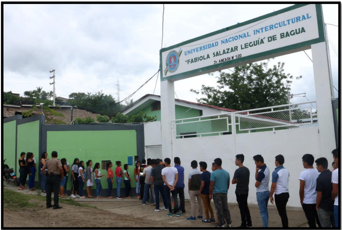
Primer examen parcial del Centro Preuniversitario 2019-I